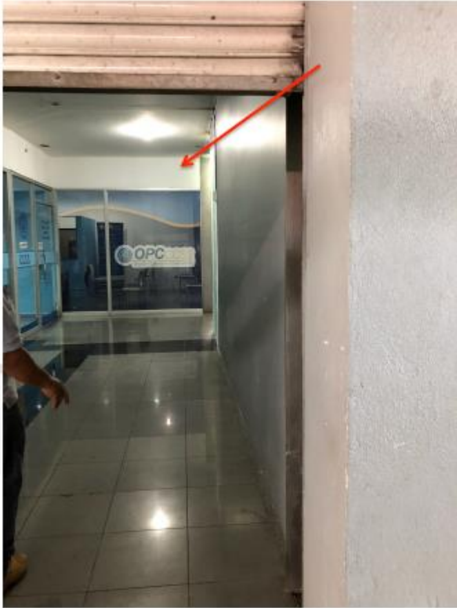
Fotografía #3 Ruta tubería de cobre y drenaje.